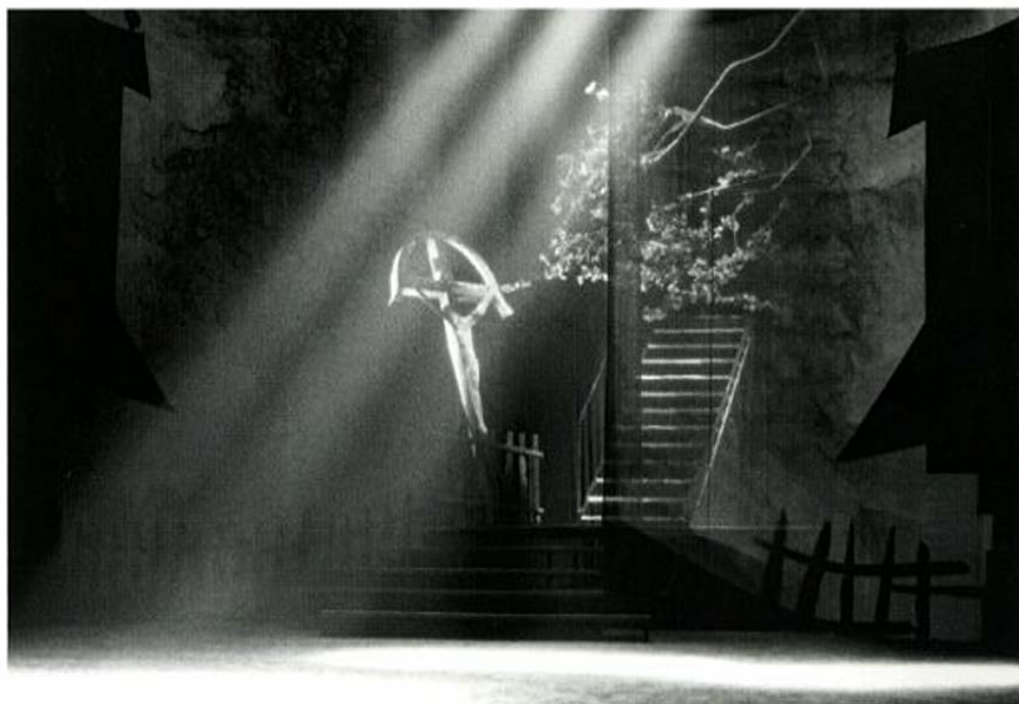
1 – 4 Štefan Králik: Vojenský kabát Jura Jánošíka, Divadlo Nová scéna Bratislava 1970, réžia: Juraj Svoboda, 1 – 3 scénické návrhy, 4 pohľad na scénu